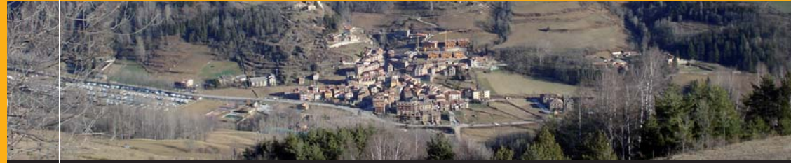
Vilallonga de Ter