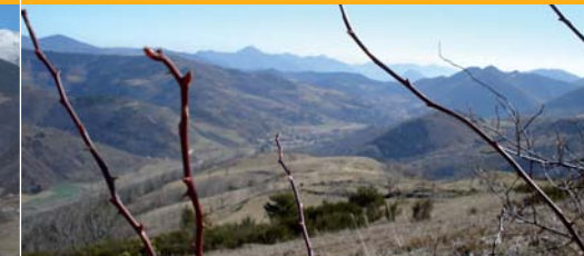
Vall de Camprodon

Avançarem a la nostra esquerra i de planer per un caminet que travessa una solellada devesa omplerta de ginestes i bardisses fins abocar-nos al torrent.