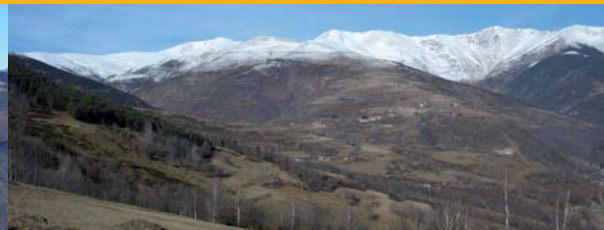
Balandrau i la coma del Catllar