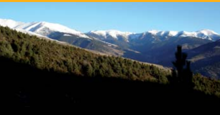
Muntanya de Setcases