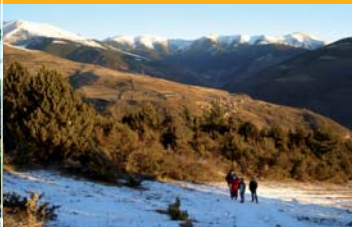
Camí del Cros