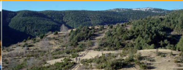
Camí del Cros