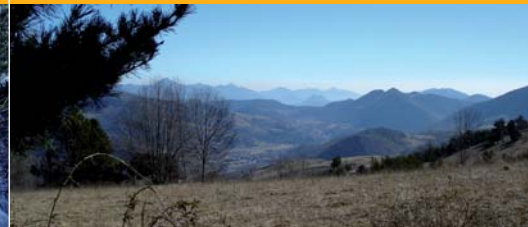
Vall de Camprodon