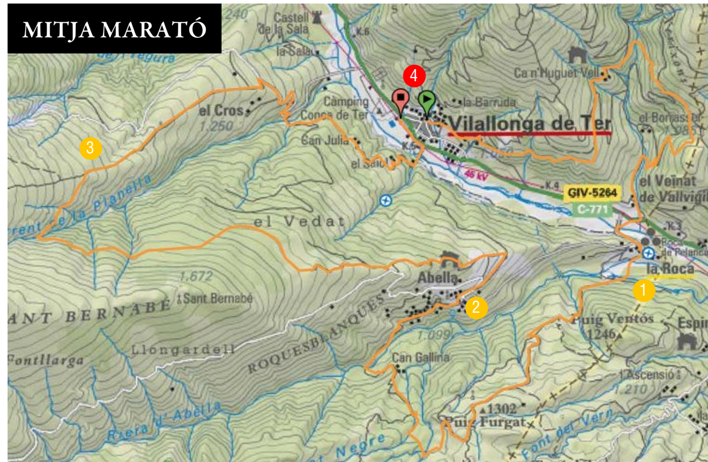
Gràfica i avituallaments de la Marató

Altura màxima: 1.604,71 m - Desnivell positiu: 2545,48 m - Distància: 42 km